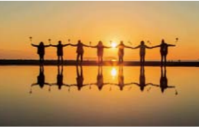
▲インスタ映えする写真が撮影できるのは、日没前後(絶景の見頃は、市観光交流局のホームページをチェック)

父母ヶ浜への臨時便を運行 仁尾町の父母ヶ浜は、昨年の来訪者が26万人を超えるなど、県内で最も注目されている絶景スポットの一つです。干潮時の日没前後に見られる夕陽が絶景だと言われています。 父母ヶ浜で夕陽を楽しんだ後の帰りの交通手段として、より多くの皆さんにご利用いただけるよう、コミュニティバス仁尾線は夏季の期間に限り、最終便以降に臨時便を1便運行しています。 父母ヶ浜への交通アクセスは、ぜひコミュニティバス仁尾線をご利用ください。 臨時便運行期間 4月から9月末 (ただし、日曜・祝日は運休) 停車バス停 臨時便は「仁尾庁舎」「詫間駅」のみで他のバス停には止まりません。 JRへの接続 詫間駅発の午後8時11分に接続できます。(上下線とも同時刻) ▲インスタ映えする写真が撮影できるのは、日没前後(絶景の見頃は、市観光交流局のホームページをチェック)