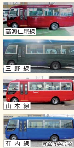
※車両は路線ごとに色分けし、分かりやすくしました

コミュニティバスの車両が新しくなります 老朽化に伴い、計画的にバス車両の更新を行います。平成29年度は、高瀬仁尾線、三野線、山本線、庄内線の4路線を更新し、4月から運行します。 ※乗車定員は29人(運転手含む)