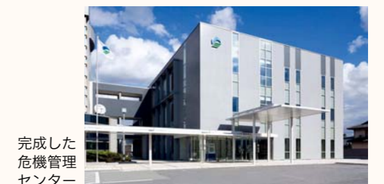
完成した 危機管理 センター