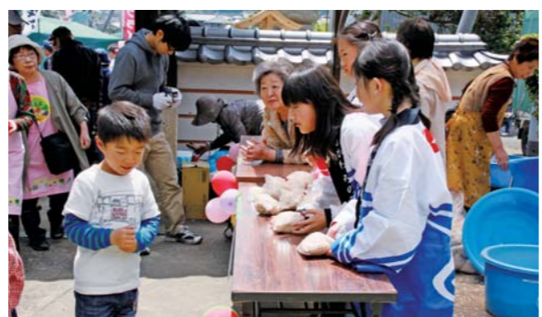
4/29 三野町 吉祥寺周辺