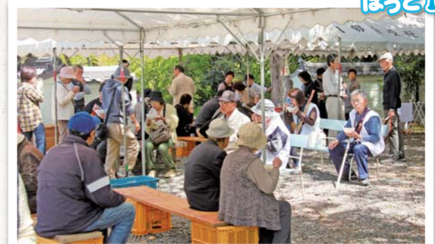
4/17 山本町 大興寺境内