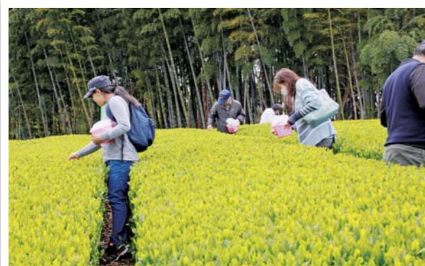
4/29 高瀬茶業組合周辺

お茶の里、二ノ宮で第25回さぬき二ノ宮ふる里まつりが行われました。実際に新茶を摘むことができる貴重なお祭りで、茶畑では家族連れなどたくさんの人たちが茶摘みを楽しんでいました。