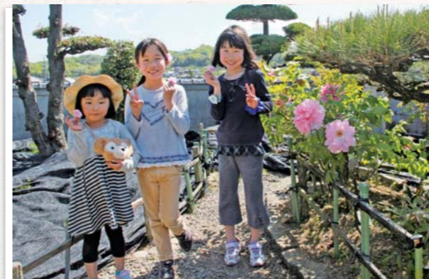
4/17 山本町 薬王寺境内

別名ぼたん寺と呼ばれている薬王寺で、ぼたん祭りが開催されました。本堂を取り囲むように咲いているカラフルなぼたんが観光客を出迎えました。