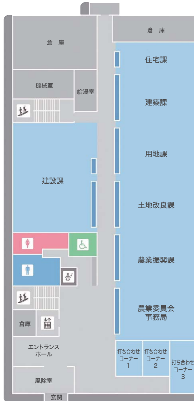
【1階】建設経済部・農業委員会