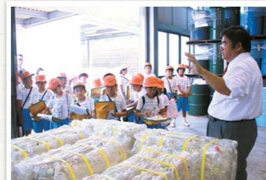
9/25 高瀬荘ごみ選別場

一般社団法人建設コンサルタンツ協会香川県支部が主催する環境学習会が行われ、詫間小学校の4年生70人が参加しました。子どもたちは家庭から出たごみが選別されている様子を見学し、環境についての正しい理解を深めました。