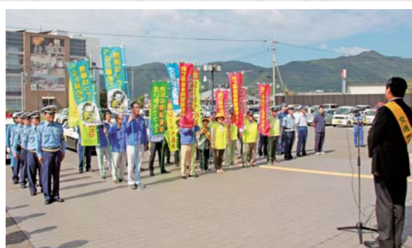
9/18 市民交流センター前

子どもと高齢者の交通事故防止を基本にした「秋の全国交通安全運動」の出発式が行われました。三豊警察署長をはじめ市交通安全対策協議会、交通安全母の会などの皆さん約50人が参加し、反射材などの着用の推進や飲酒運転の根絶を呼び掛けるキャンペーンを展開しました。