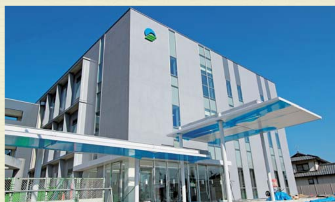
▲建設中の危機管理センター