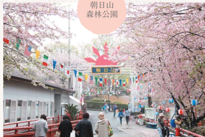
▲肌寒い日でしたが、訪れた人は満開の桜を堪能しました