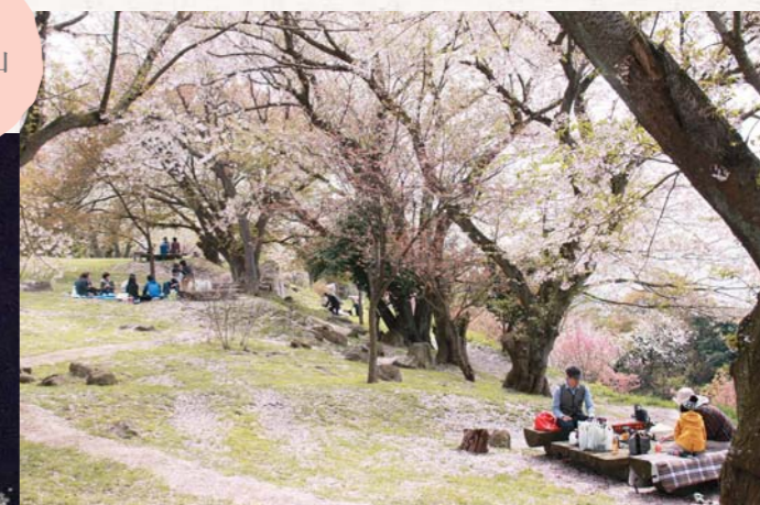
▲桜の下で食べるお弁当はおいしい♡