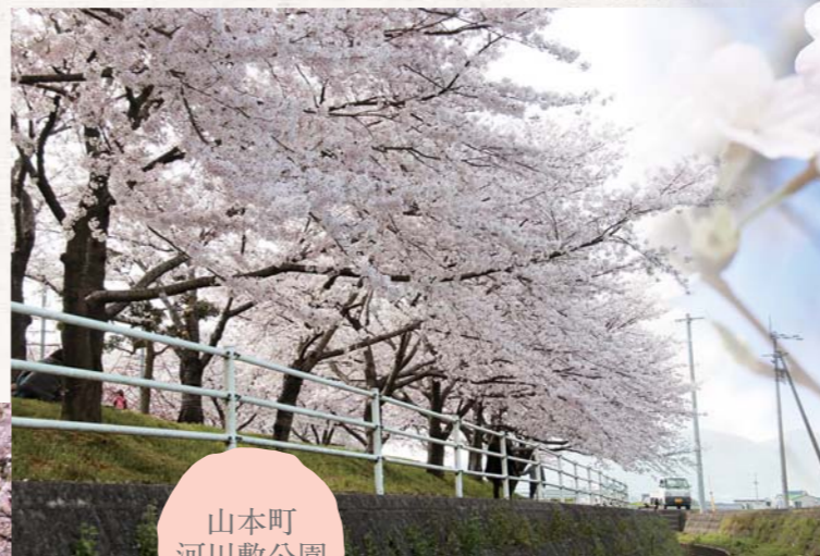
山本町 河川敷公園