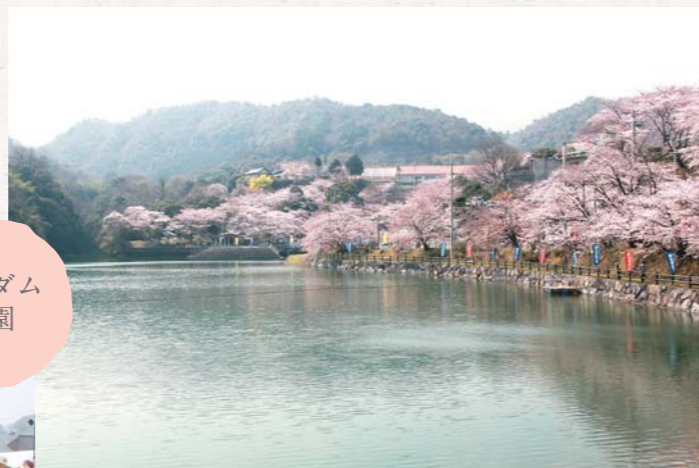
▲水辺の桜に心が和みます