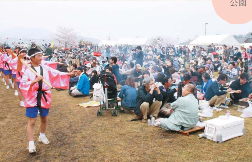
▲和光中学校の生徒が鉦踊りを披露。お客さんも大喜び！