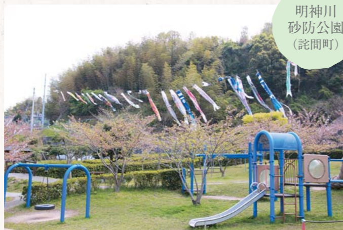
▲たくさんのこいのぼりが風になびいていました