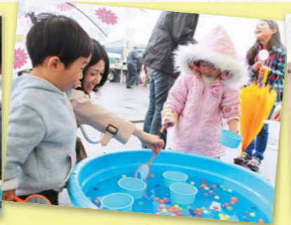
▲家族連れでにぎわいました