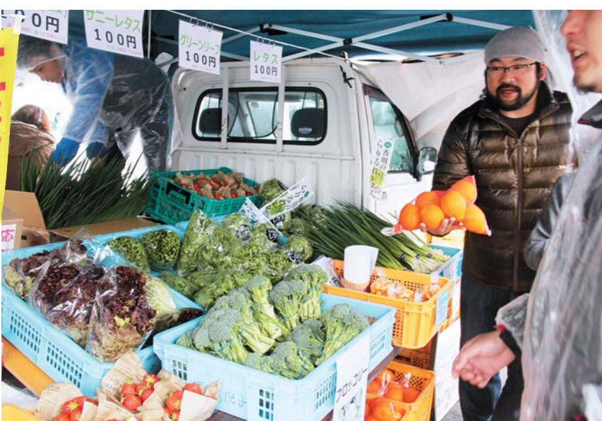
4/13 高瀬町環境改善センター前