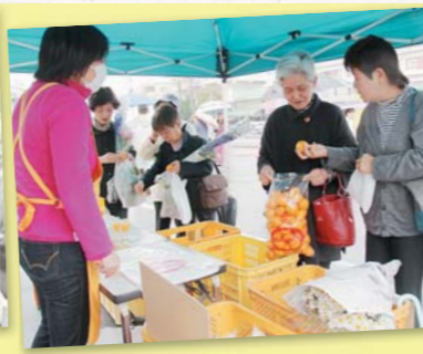
▲好きなものを好きにだけ♪