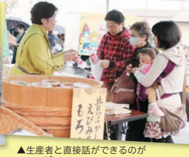
▲生産者と直接話ができるのが軽トラ市の魅力