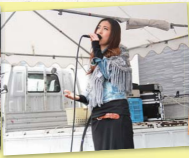
▲音楽ライブに来場者も思わず足を止めて