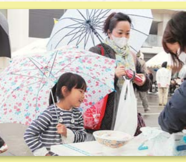
▲たくさんの笑顔に出会えました