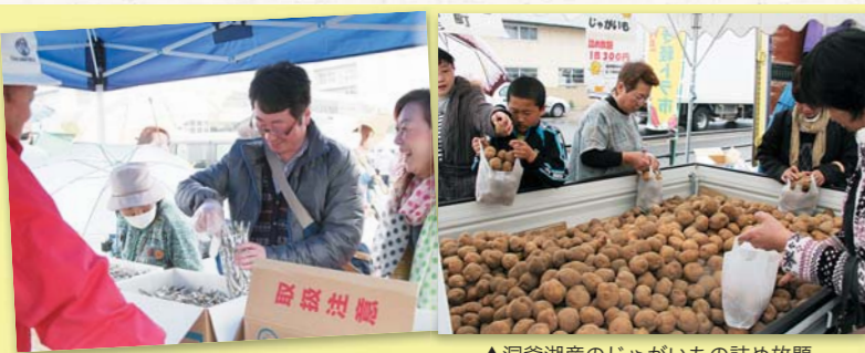
▲いりこなどの海産物も