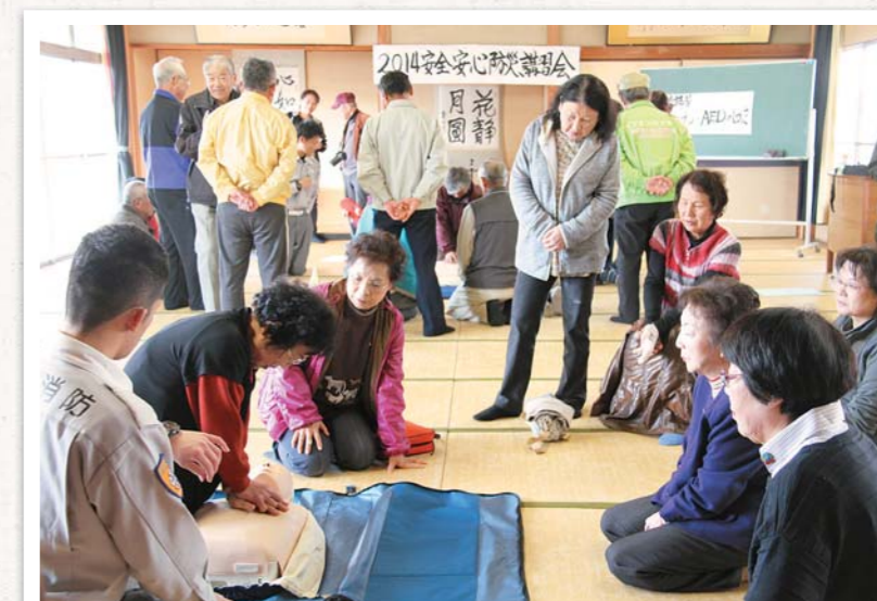
3/16 高瀬町公民館周辺

まちづくり推進隊高瀬が実施した、2014安全・安心防災実技講習会に、会員約50人が参加しました。「心臓マッサージはメトロノームに合わせて、出来るだけ垂直に押し、救急車が来るまで押し続ける」など、実益のある講習会となりました。広域消防の講師は「一番大切なことは、自分の身は自分で守ること。日頃から避難経路を歩いて確かめておいてほしい」と訴えていました。