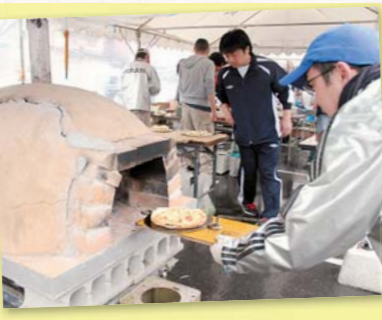
▲持ち運びできるピザ釜も登場