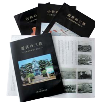
フルカラーA4版 全110ページ 1冊1,000円

『古代の三豊』『中世の三豊』『近世の三豊』に続き、「三豊の歴史と文化」シリーズ完結編となる『近代の三豊』を刊行しました。 江戸時代から明治維新、そして昭和にかけて三豊市域がどのような役割を担ってきたのか、資料を提示しながら、分かりやすく説明しています。