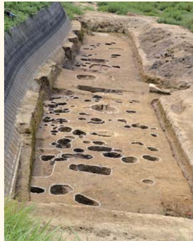
▲発掘状況写真(穴はすべて弥生時代の建物などの痕跡)