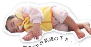
すやすやお昼寝の子も...