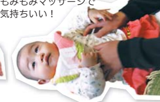
ももみマッサージで気持ちいい!