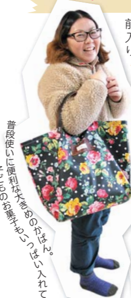
普段使いに便利だからお気に入りを入れて子どものお鞆の中に入れて

前は手作りエプロンや箸袋、入園グッズなど色々なものがありました。今回は何があるかな?