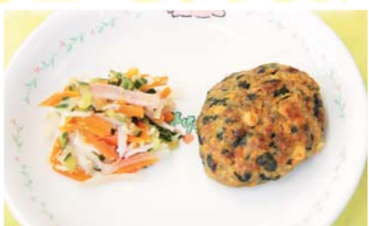
ポパイハンバーグ(5人分) (左はかみかみ和え)