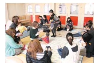
みんなでワイワイ楽しい時間