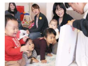
子どもが喜ぶ絵本の読み聞かせ

夜泣きや後追いで悩んでいるお母さん。みんなもそうなんだと分かっただけでも不安解消。今日も元気をもらえました。