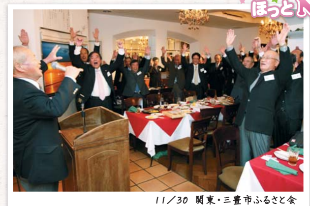
11/30 関東・三豊市ふるさと会

関西および関東・三豊市ふるさと会の総会が開催され、来年度の事業計画や今後の取り組みを話し合った後、地元出身の歌手や落語家を招き歓談。また「お楽しみ抽せん会」では、ふるさと三豊の新品や伝統の味を紹介しました。