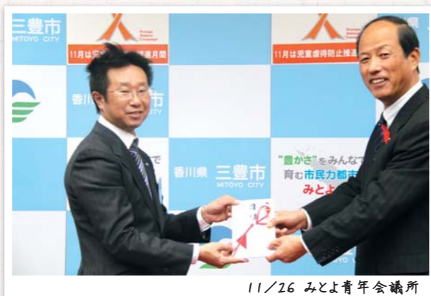
11/26 みとよ青年会議所