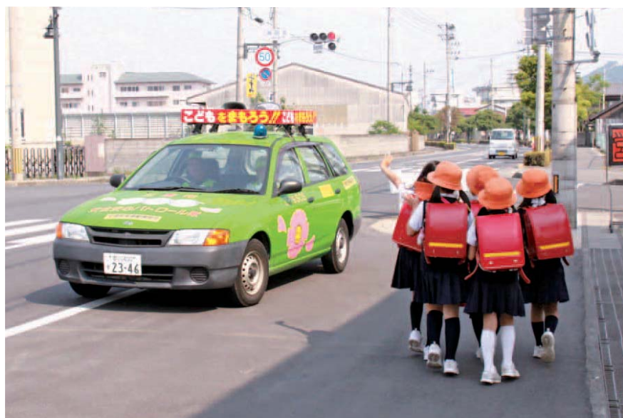
▲グリーンパトロール隊による巡回もまちづくり推進隊に