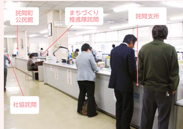
託問庁舎 各種団体の配置図

まちづくり推進隊は、市から独立して市民によるまちづくり活動を始めています。モデル地域のまちづくり推進隊託問は託問庁舎1階に事務所を置き、4月から精力的に活動をしています。