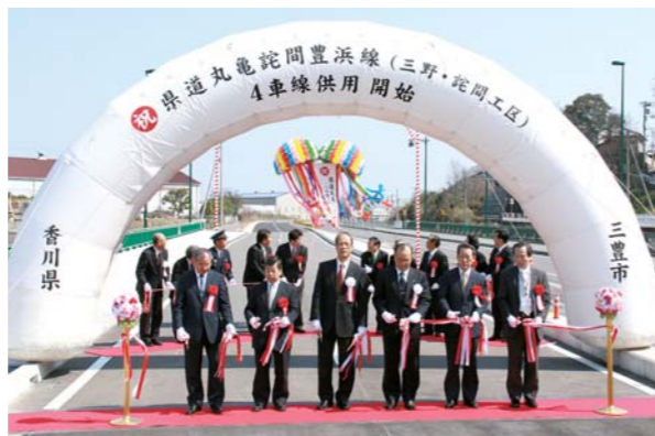
▲通行開始を祝ってテープカットとくす玉開披