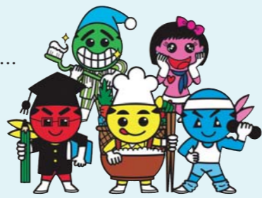
介護予防レンジャー