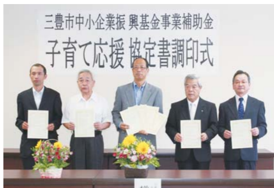
三豊市中小企業振興基金事業補助金 子育て応援協定書調印式

昨年度に引き続き、中小企業振興基 金事業補助金「子育て応援協定締結事 業」に申請された次の4社と新たに子 育て応援協定を締結しました。この事 業は、子育てと仕事が両立できる職場 環境の整備や、子育て支援への積極的 な取り組みを実施した場合に、市から 応援金を支給するものです。