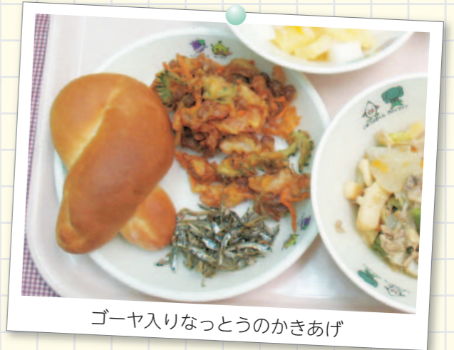
ゴーヤ入りなっとうのかきあげ