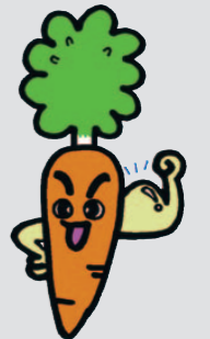
スタミナにんじん