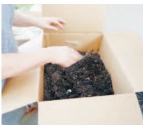
▲ダンボールコンポスト