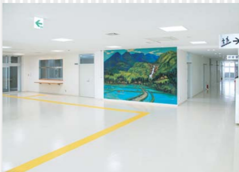
▲豊中町農村環境改善センター