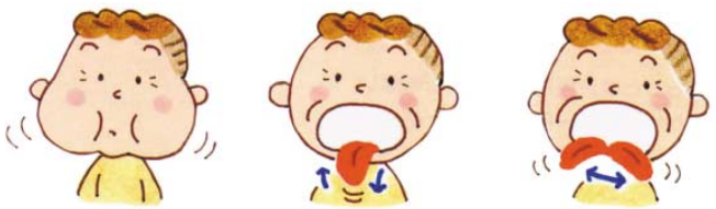
口のまわりの筋肉の運動

口の周囲の筋肉は、食事をする時、重要な役割を果たします。食事をこぼすようになったとか、食後は口の中に食べかすが多く残るようになったなどは、筋肉の低下が考えられます。これに効果があるのが、口を膨らませたり、反対に頬を歯と歯の間に吸い込むなどの運動です。また誤嚥(ごえん)本来は食道に入るべき物が肺に入ること(の予防には舌を出し入れしたり、上下左右に動かす運動が効果的です。ぜひお試しください。