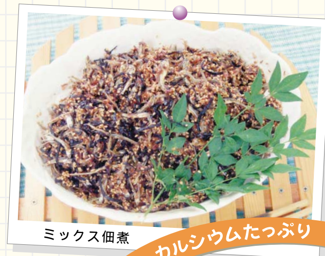
ミックス佃煮 カルシウムたっぷり

市民の皆さんが考えた今が旬の三豊産の野菜や果物などを使った料理のレシピを紹介しています。