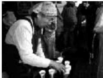
二ノ宮公民館でお茶のお接待

JR高瀬駅から出発して、二ノ宮公民館( )に着くと、早速、温かいお茶でお接待。さすがお茶