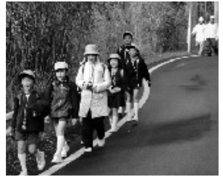
毎日登下校を見守っています

朝夕に小学校近くで、子どもたちにあいさつをしたり、誘導したりする人を見かけますが、それは「子ども見守り隊」の皆さんです。名称は地域によっていろいろです。