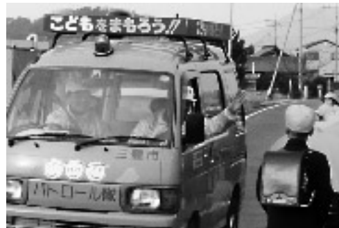
毎日、どこかで会えます

夕方、青い回転灯をつけ、「なんしょんな。どっしょんな。...」と音楽をかけている緑