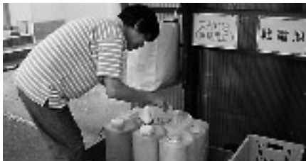
専用のポリタンクとじょうごを備えていますので、移し替えてください