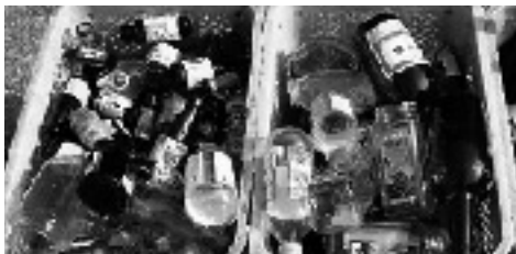
キャップはすべて取り除かれ、中の汚れもありません