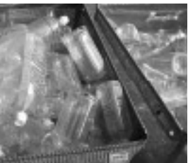
キャップとラベルがすべて取り除かれ、中の汚れもありません

A. 目で確認できる汚れがあるものや、工作などに使用したもの(切る、貼り付ける、絵などを描く)は燃やせないごみとして出してください。