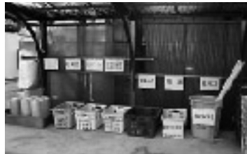
表示している品目ごとに備え付けのキャリーに自分で入れてください