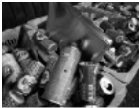
スプレー缶は穴が開けられています