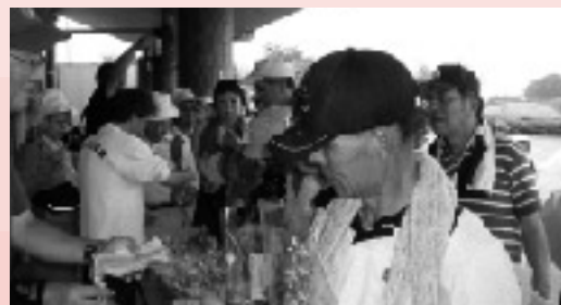
産直「心泉市たかせ」