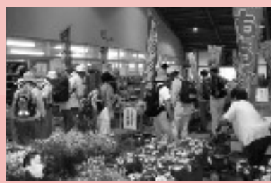
産直フレッシュあさの市

つばい買物をしていたね。 産直から朝漬けの素のプレゼントがありました。 次は、ここから坂道を2km程上ったところにある首山観音。