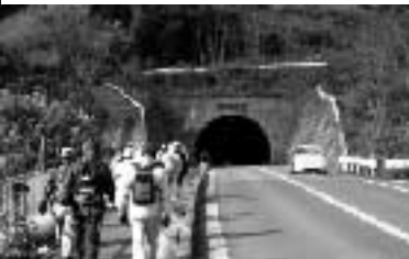
七宝山トンネルの入り口

第10回目は、昨年12月6日に開催した「七宝山トンネルで行く、曾保みかん狩りと新スポット『古木里庫』のレトロな空間ウォーク」を紹介します。