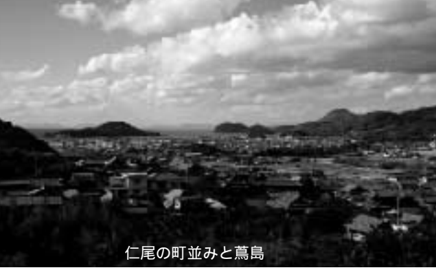
仁尾の町並みと島

を神社のお旅所まで歩いて、緩やかな坂道を上り、農道に出て吉津峠に向かったね。 高台にある農道からは、仁尾の町並みと島（）がよく見渡せました。