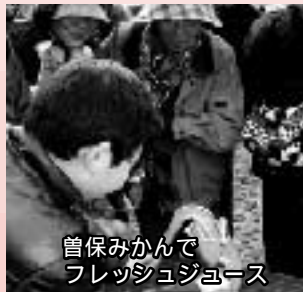
曾保みかんフレッシュジュース

「このみかんで作ったフレッシュジュース( )をいただいたね。このジュースは、みかん2個を絞り器でゆつくり絞ったぜいたくなジュースなんだよ。すこ〜くおいしかった。」