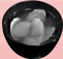
古木里庫でいただいた「はまぐり汁」

「入館してすぐに、「はまぐり汁」( )をいただきました。地元で取れたはまぐりがいっぱい入っていたよ。ほんと、おいしかった。」