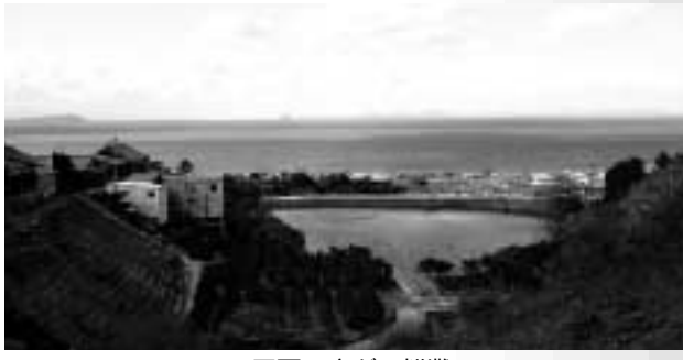
正面に広がる燧灘

んな高瀬駅に急いで歩きました。 今回は、みかん狩りや絞りたてのフレッシュユジユース、不思議空間「古木里庫」などのウオークでした。が、充分に楽しめたかな？ 帰りは、峠越えて距離もあり、少ししんどかったけど面白いコースだったね。 今後もおもしろい企画やコースを作って、みんなを楽しませるとするか。おっほん。