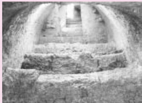
むねよしがようあと 宗吉瓦窯跡