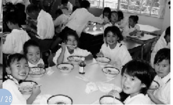
自分たちで作ったうどんは最高！（比地大小）