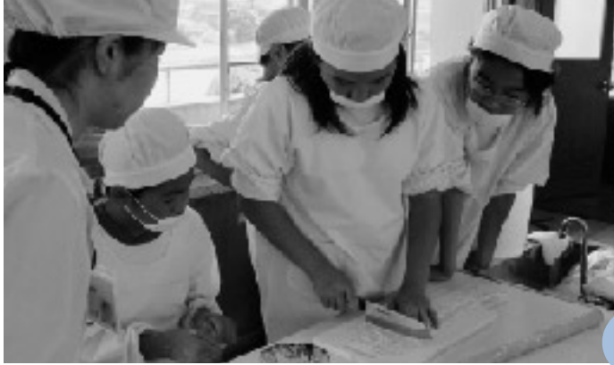
包丁を使って上手に切りました（桑山小）