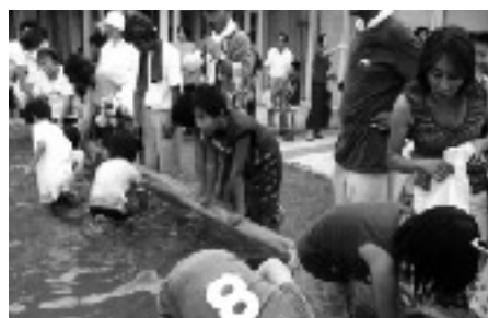
うなぎのつかみ取り

三豊市ホームページで 7月いっぱい、募集! http://www.citymitoyo.g.jp/