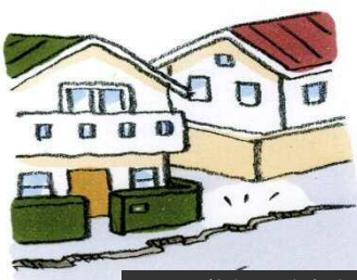
地面にひびわれや段差ができる