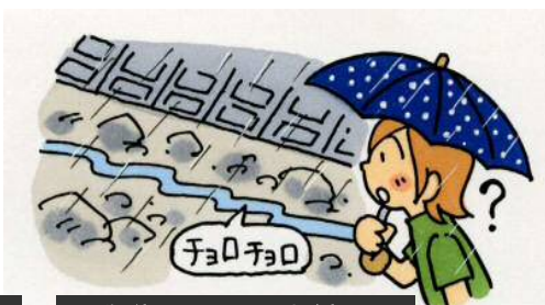
雨は降り続けているのに川の水が減る