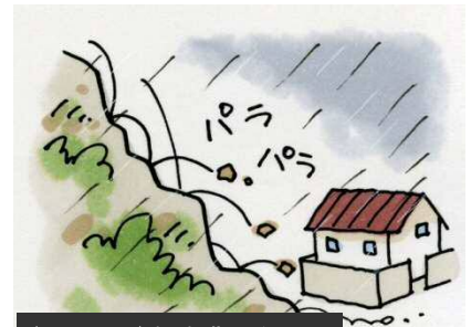
がけから小石がバラバラ落ちてくる