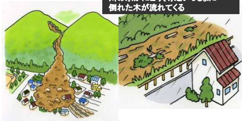
川の水がにごり、水といっしょに倒れた木が流れてくる