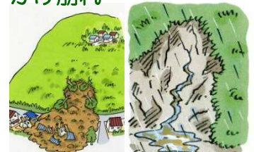
がけから急に水が湧き出る