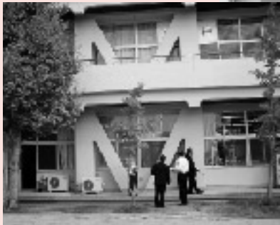
耐震補強された校舎

10月10日開催の教育民生常任委員会において、仁尾中学校校舎耐震補強工事、桑山小学校校舎耐震補強及びトイレ改修工事、比地大小学校校舎耐震補強及び改修工事について、地震対策による耐震工事を完了に伴う現地調査を行った。現地を確認しながら担当者より説明を受けたが、とりわけ問題になるような点はなかった。