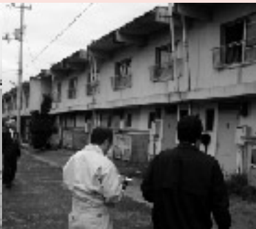
現状を調査する委員