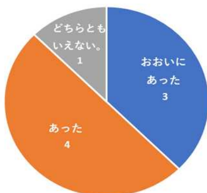
3. 令和7年11月支援金の効果