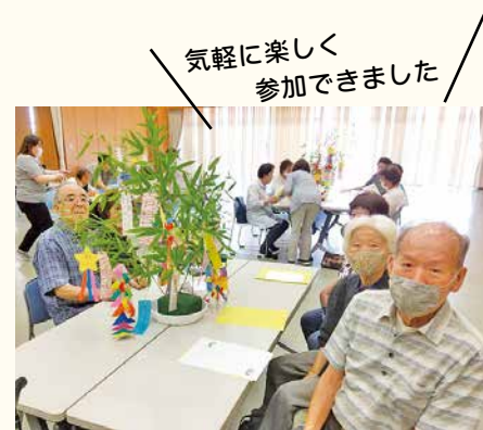
▲7月に仁尾町文化会館で開催したオレンジかふえ