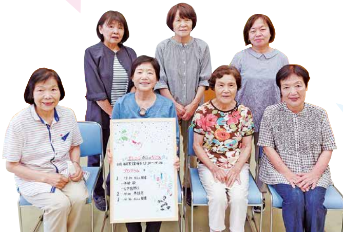
▲仁尾町文化会館でオレンジかふえを開催している「なごみ」の皆さん

かふえは、誰でも気軽に参加して、認知症について学び理解が深まる場所にできたらと思っています。