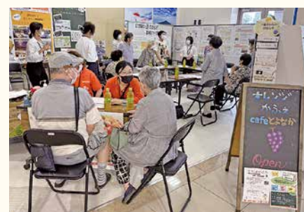
▲9月にゆめタウン三豊で開催されたカフェ