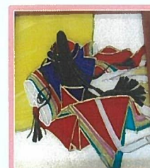
ガラスアート教室 会員さんの作品