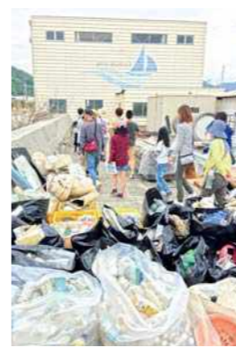
▲仁尾の海岸に漂着したごみ

タラ号の乗船体験に合わせて、仁尾の海岸ではごみ拾いが実施されました。集まったごみは、1日でなんと300キロ！環境問題は、遠い海の話ではありません。私たちが住む身近な場所にも存在しています。だからこそ、できることを一つずつ行動に移すことが大切です。