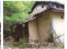
③ 島八十八ヶ所3番札所付近