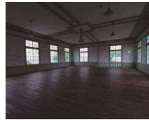
① 粟島海洋記念館2階ホール