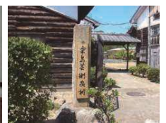
⑦ 粟島芸術家村アトリエ(粟島中学校)