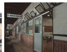
⑤ 粟島中学校2年生教室