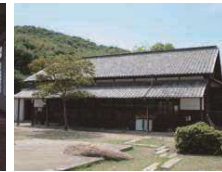
② 粟島海洋記念館武道場