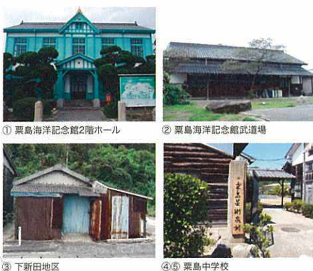
① 粟島海洋記念館2階ホール ② 粟島海洋記念館武道場 ③ 下新田地区 ④ 粟島中学校