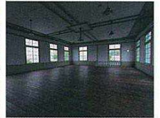
③ 粟島海洋記念館2階ホール