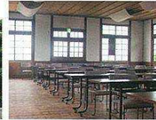
① 粟島海洋記念館大研修室