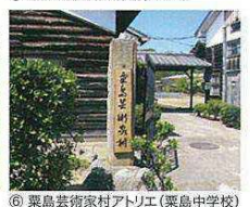
⑥ 粟島芸術家村アトリエ(粟島中学校)