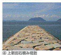
④ 上新田石積み堤防