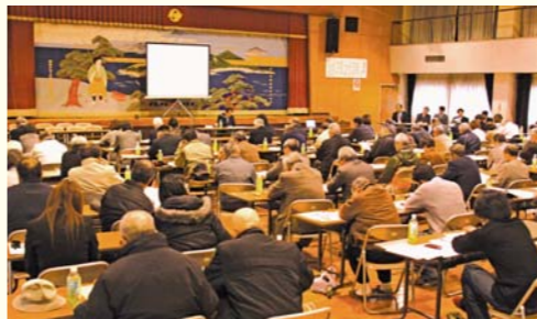
▲まちづくり組織設立総会

託問地区において「まちづくり推進隊」を設立し、現在会員を募っている。今後2年間をかけて、他の6