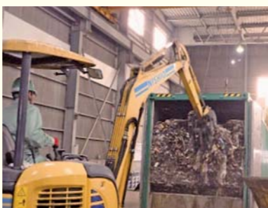
▲トンネルコンポスト方式実証実験

トンネルコンポスト方式によるごみ処理施設の稼働までの間、集積場などを整備するための予算計上は。