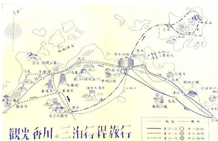
観光香川の三泊行程旅行