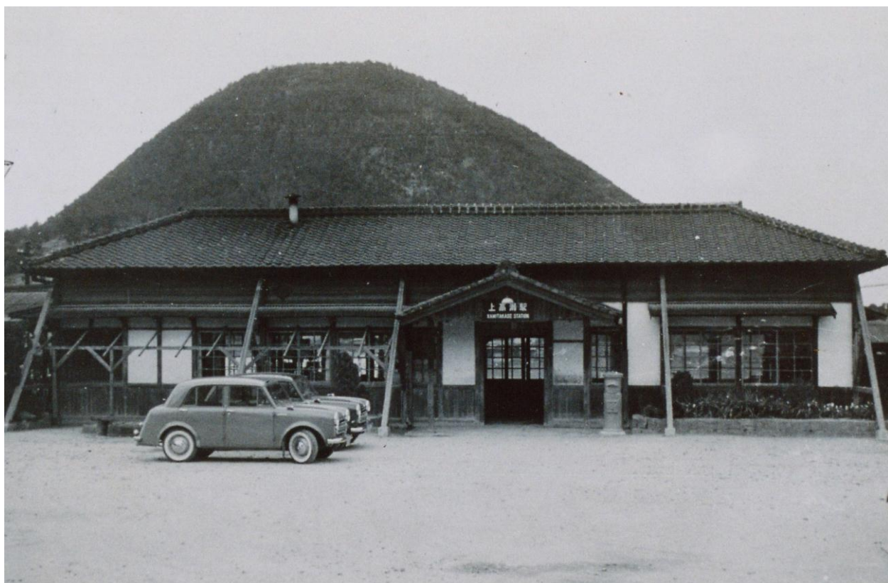
上高瀬駅(現、高瀬駅) 昭和 30(1955)年代