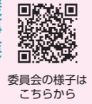
委員会の様子はこちらから