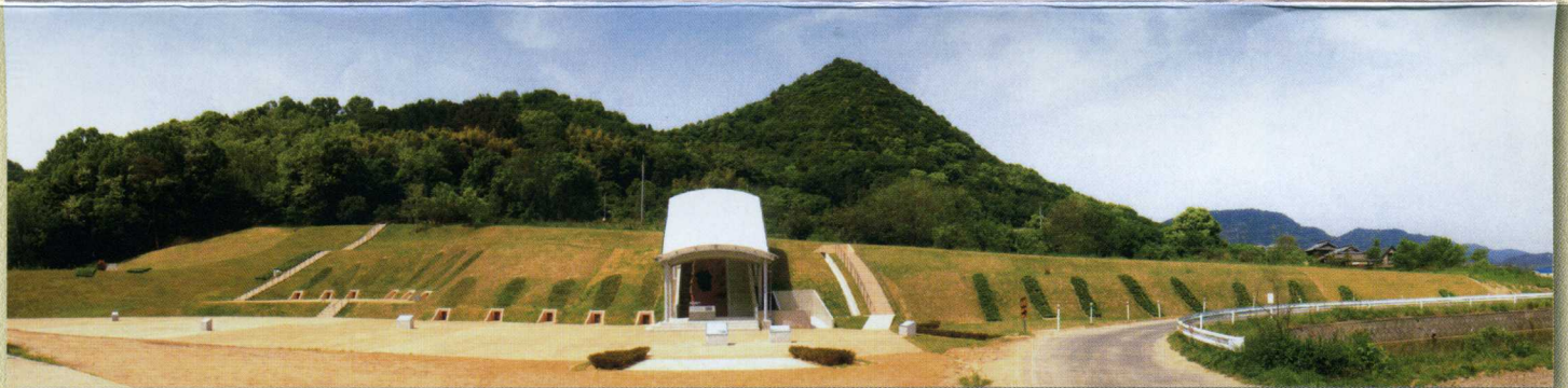
史跡宗吉瓦窯跡の全景（中央の16号窯は実物大で復元し、他の窯は植栽であらわしています。）