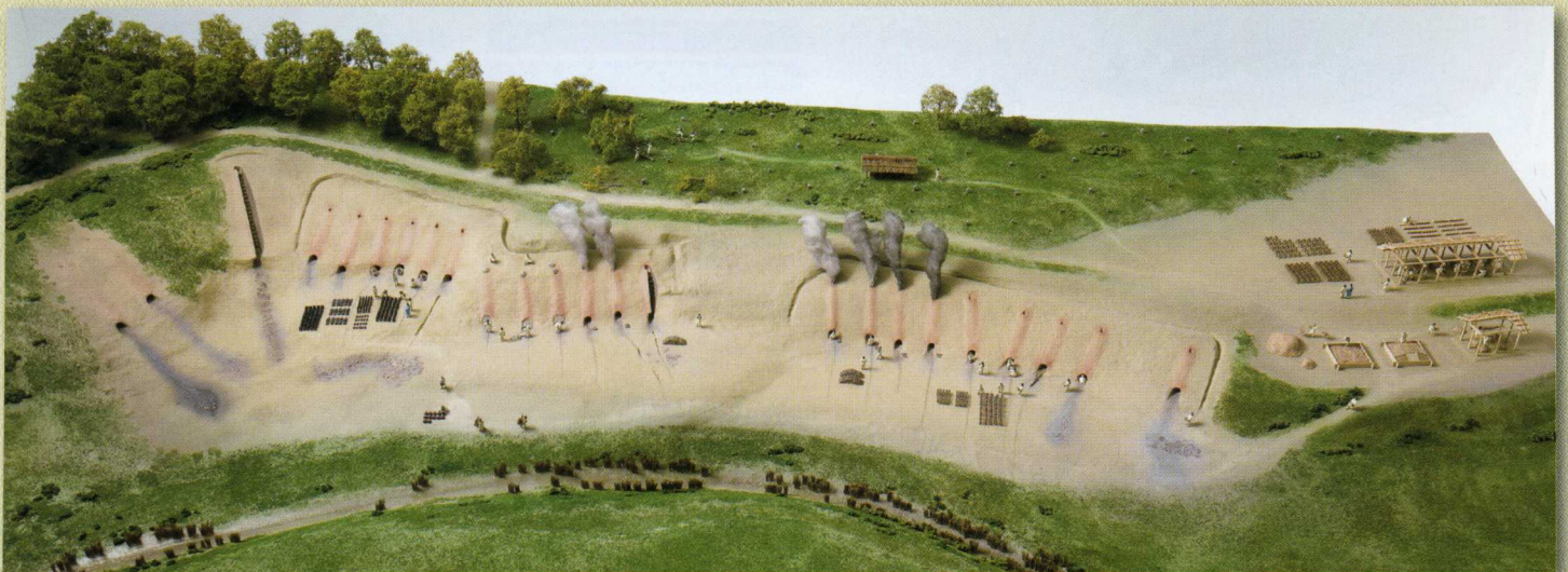
宗吉瓦窯での瓦づくりのようす（推定復元模型）