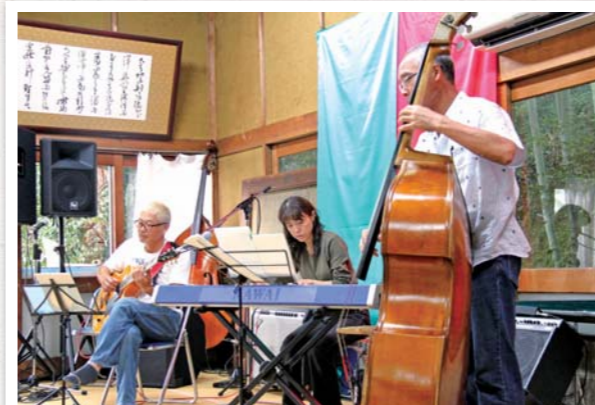
9/1 詫間浪打八幡神社

浪打の森JAZZ FESTIVALが開かれ、三豊・観音寺の8グループが、ジャズを奏でました。定番曲やポップスをアレンジした曲など、8時間にわたる演奏が繰り広げられ、訪れた人はジャズの音色に魅了されていました。